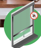
SÍTĚ PROTI HMYZU